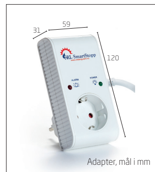
Adapter, mål i mm