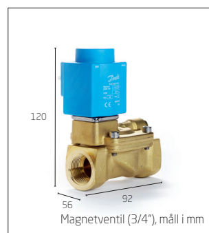
Magnetventil (3/4"), mål i mm