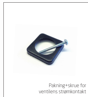
Pakning+skrue for ventilens strømkontakt